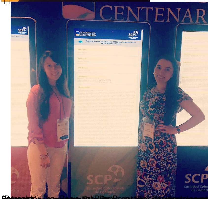
El Instituto Roosevelt participó en el Congreso Centenario de la Sociedad Colombiana de Pediatría